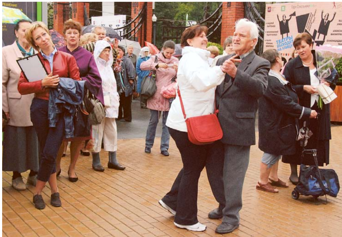
Дождь не помешал веселью