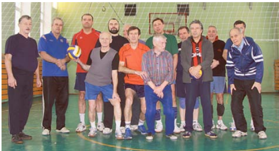
Нам года — не беда