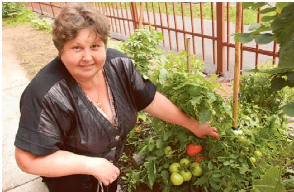
...и на улицах Москвы помидоры растут